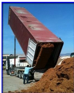
Descarga contenedor abatible

La información anterior se obtuvo a través de nuestro conocimiento, elementos agronómicos hoy bien consolidados, controles de calidad constantes y colaboración con nuestros clientes, sin embargo, nos reservamos el derecho de introducir cambios si se encuentran variaciones. La Mundial de Coco SRL no se hace responsable de las consecuencias adversas derivadas del uso incorrecto de este producto.